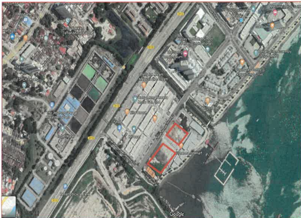
Lokasi PT 214 & PT 217