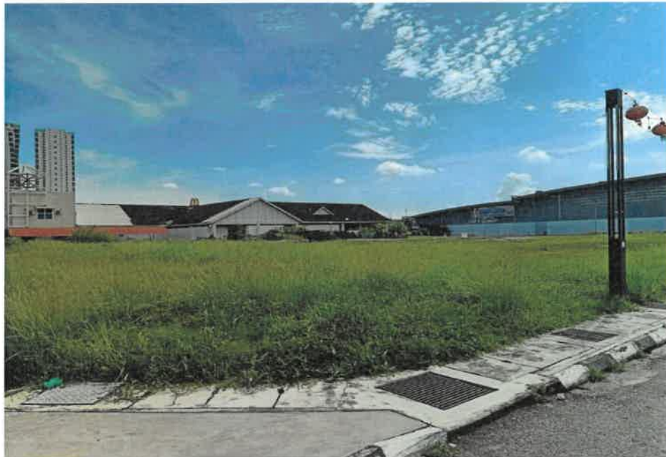
Tapak PT 214 (1 ekar)

PT 214 dan PT 217, Seksyen 8, Bandar George Town, DTL, Pulau Pinang berkeluasan 3.2 ekar bersamaan 12,949.90 meter persegi. Syarat nyata tanah bagi PT 214 adalah komersial manakala syarat nyata tanah bagi PT 217 adalah Akademi Badminton Pulau Pinang. Kedua-dua tanah terletak bersebelahan antara satu sama lain dan terbahagi dengan laluan jalan.