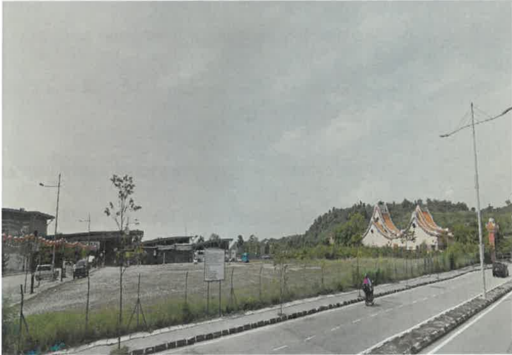
Tapak PT 217 (2.2 ekar)